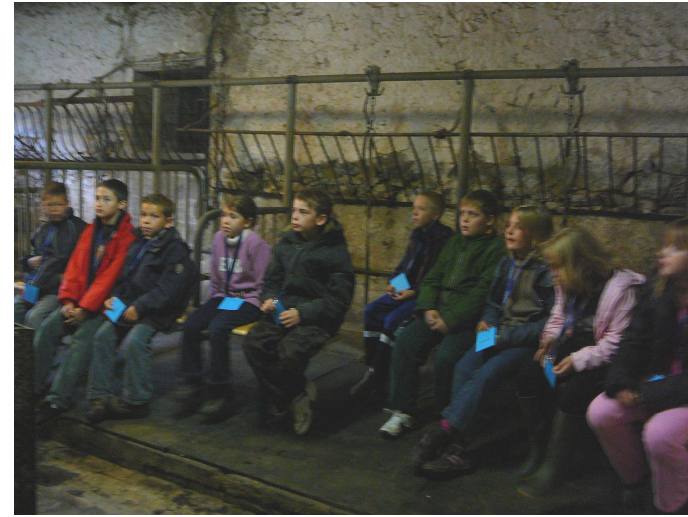
Les analyses de terre