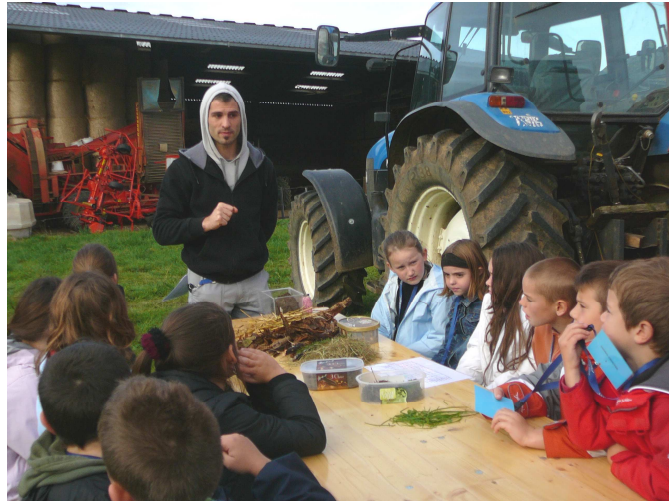
Insectes et agriculture