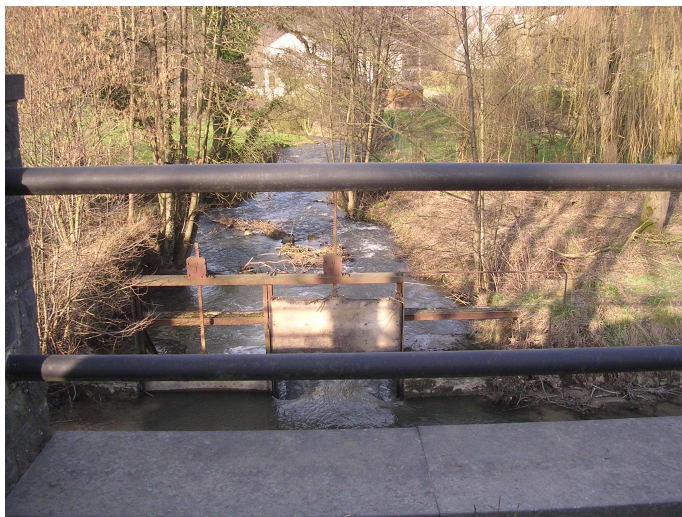
Les Avins, le Hoyoux, le pont, la vanne, le bief.