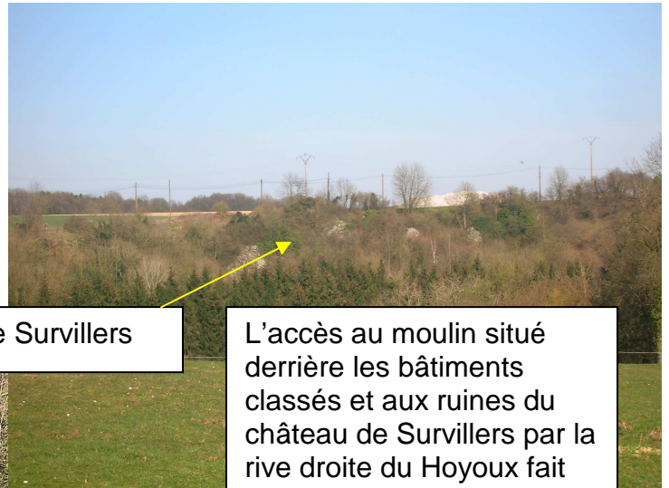
Ruines de Survillers