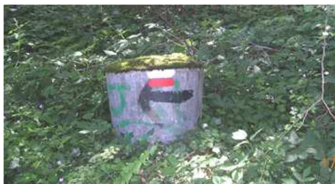
Une borne frontière...sur le GR576