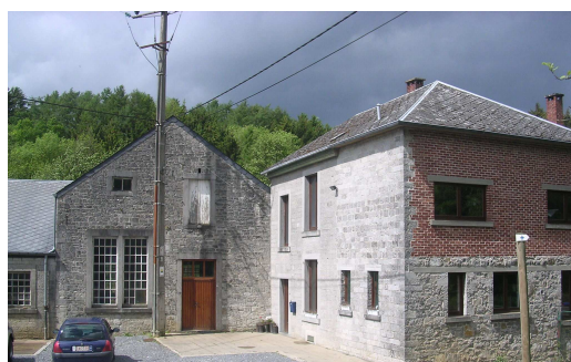
La Maison des Eaux et ses « trésors »