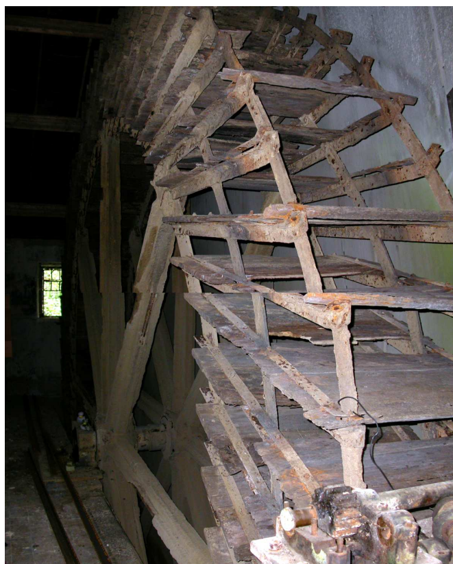
La grande roue de 9,20 m de diamètre