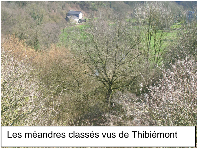
Les méandres classés vus de Thibiémont